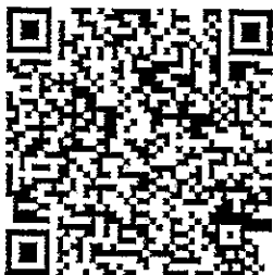
QR Code Website ประกาศ